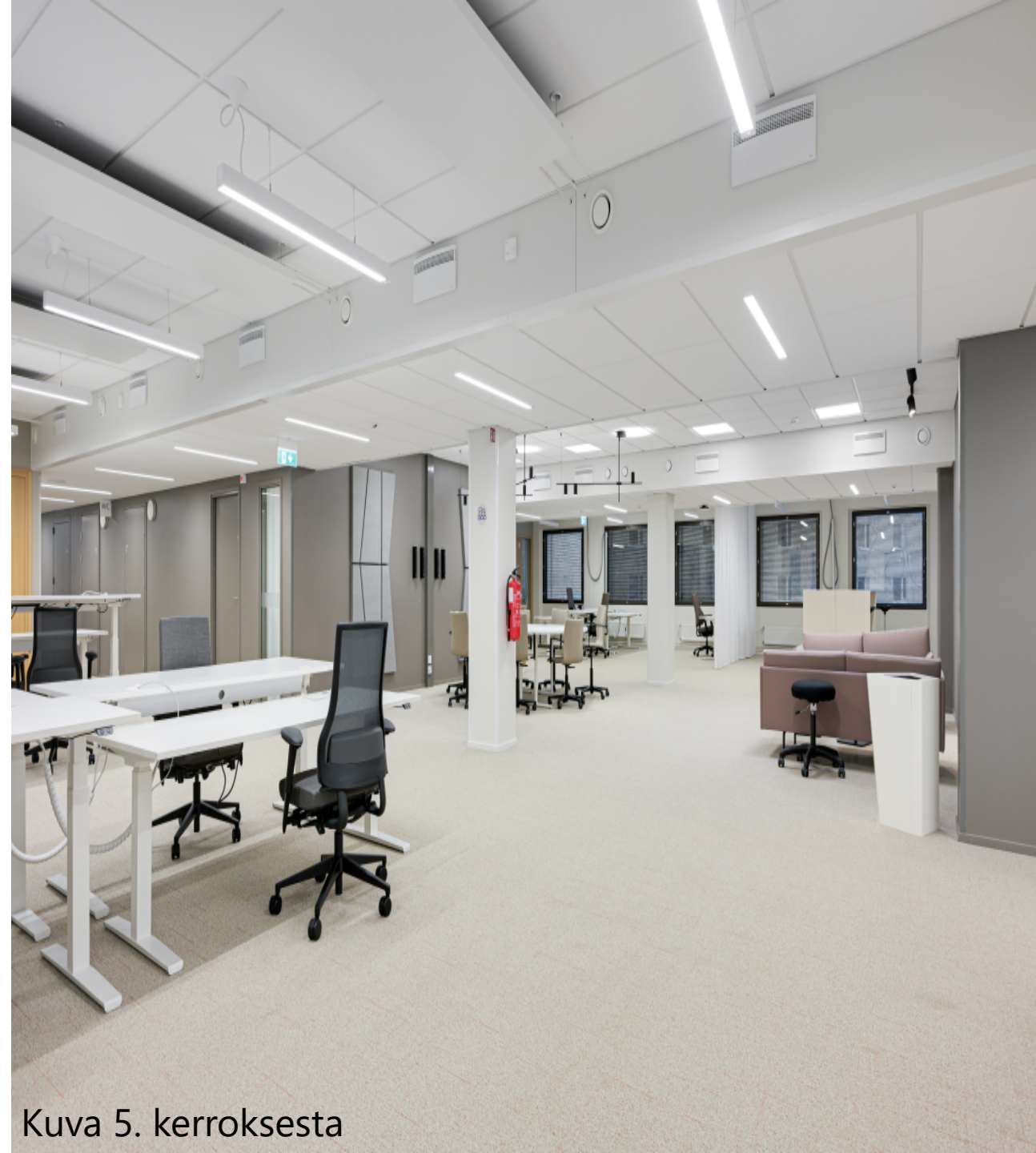
Kuva 5. kerroksesta

Tilat soveltuu hyvin sellaisenaan käyttöön.