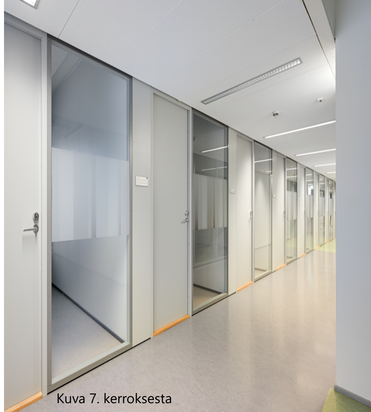
Kuva 7. kerroksesta

Tilat ovat toimivia sellaisenaan, mutta pienestä ehostamisesta voidaan neuvotella.